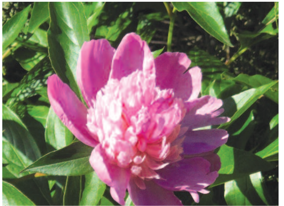
Aldott szép Pünkösdsnek gyönyörű ideje, (...) te nyitod rózsákat meg illatozásra