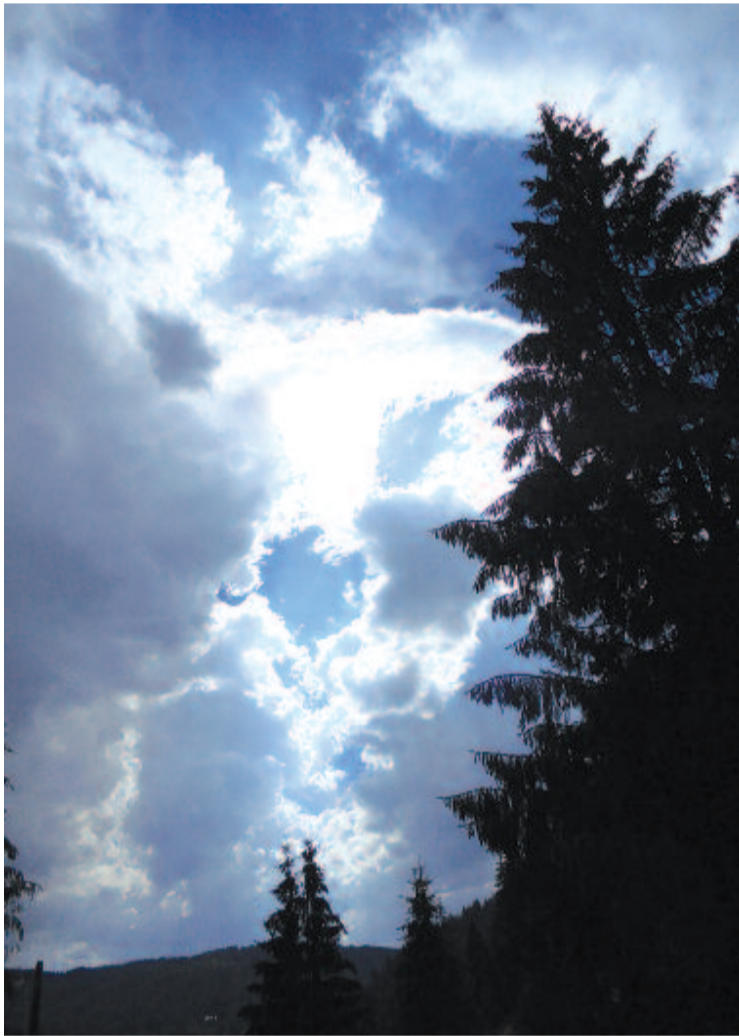
S a fenyves felett megjelenik a Napba öltözött