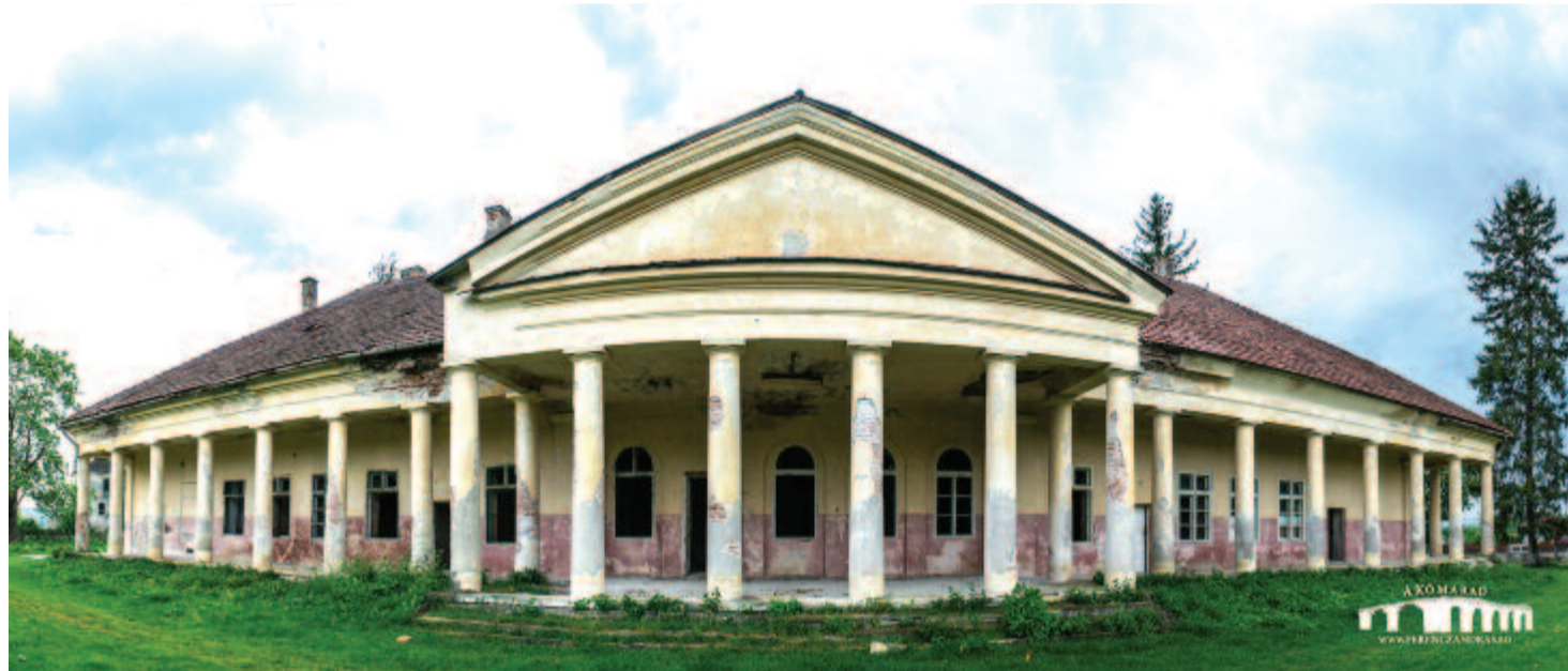
A szentbenedeki Kornis-kastély

– Így látom Marosvásárhelyt, de akár Erdélyt is: rengeteg potenciál van benne, de le kéne szokjanak az emberek arról, hogy mindent holnap akarjanak megcsinálni, és máris sokkal jobb lenne itt élni.