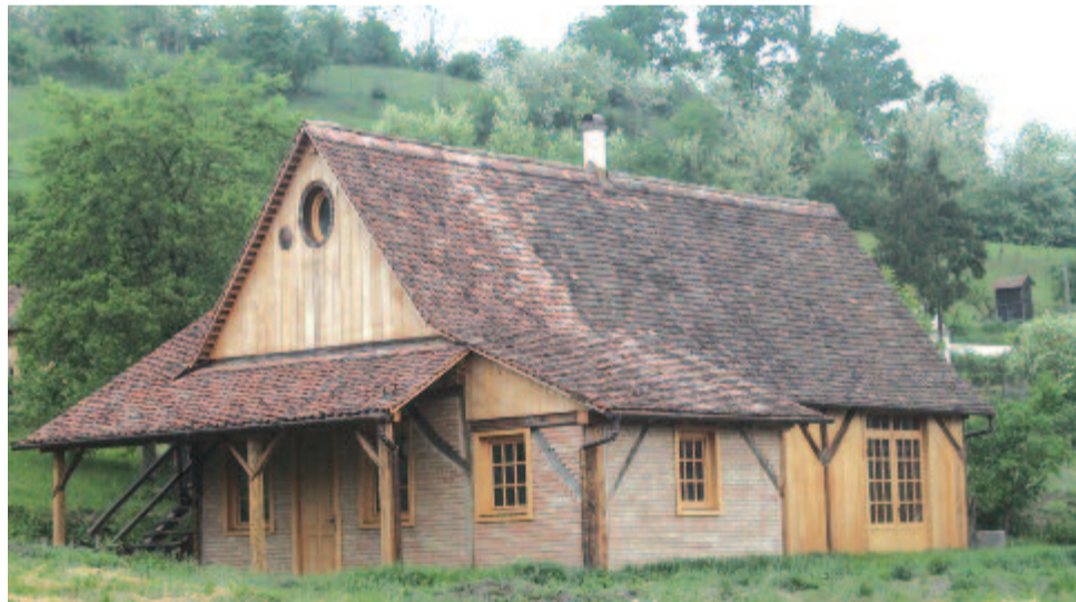
A felújított csűr