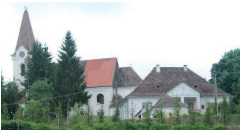
A volt evangélikus iskola