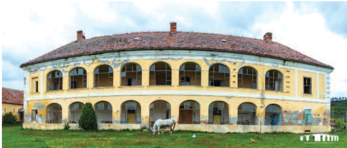
A mezőörményesi Rákóczi-Bánffy-kastély